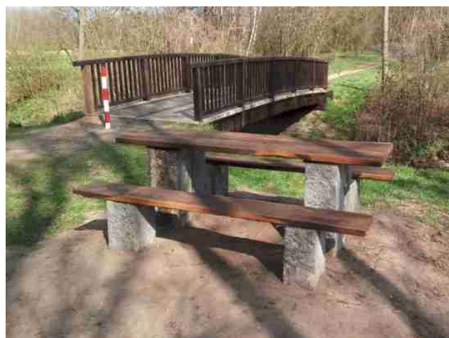
Direkt gegenüber der VERA-Bahndammfläche steht jetzt eine einladende Sitzgruppe