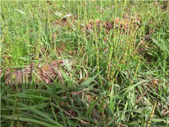
(Duwock auf der VERA-Stamplatzfläche)

Dieses Jahr wurde im April nach wenigen warmen Tagen gleich mal wieder ein weiterer Trockenheits-Rekord-Sommer medienwirksam prognostiziert. Dies trat jedoch nicht ein. Der Mai war eher zu kühl. Trocken ist der Boden immer noch. Die fehlenden Niederschläge aus 2018 sind nicht annähernd nachgeholt. Aber die starke Wärme blieb dieses Jahr bisher aus.