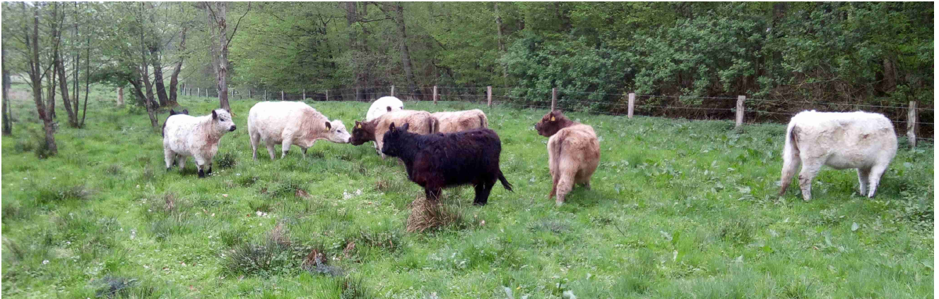
Bahndammfläche: Beschnupern nach Abschluss der Transporte