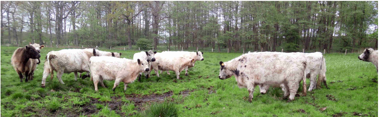
Quellentalfäche: Erste Kontaktaufnahme der Zugereisten