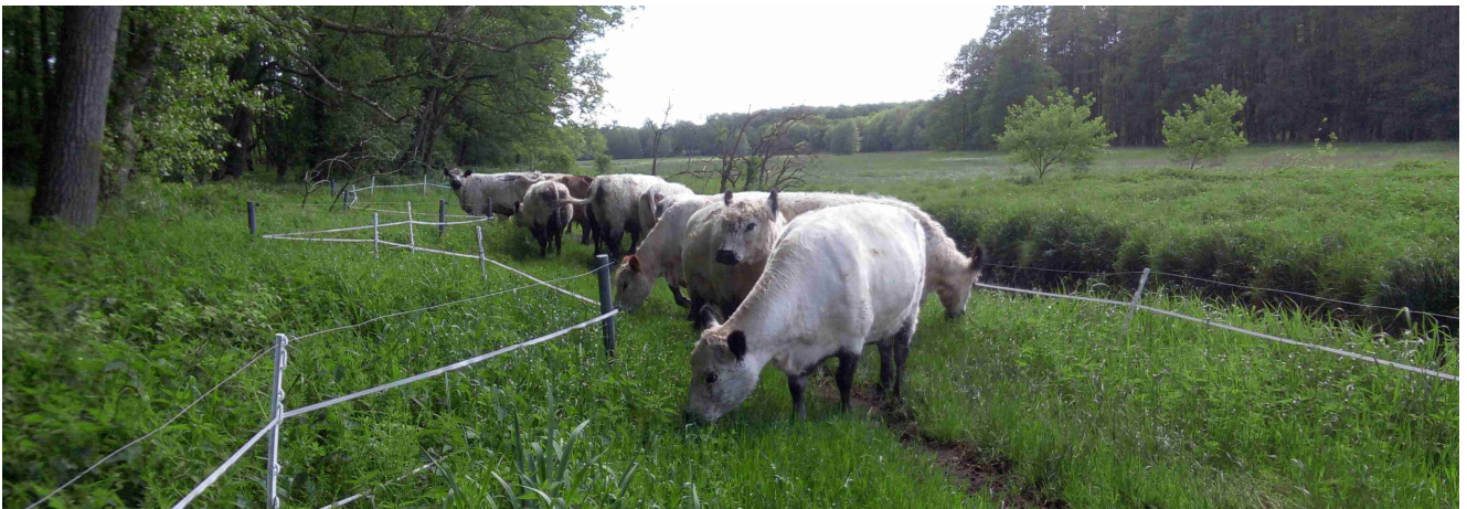
Gallys auf dem Unterhaltungsstreifen Ende Mai