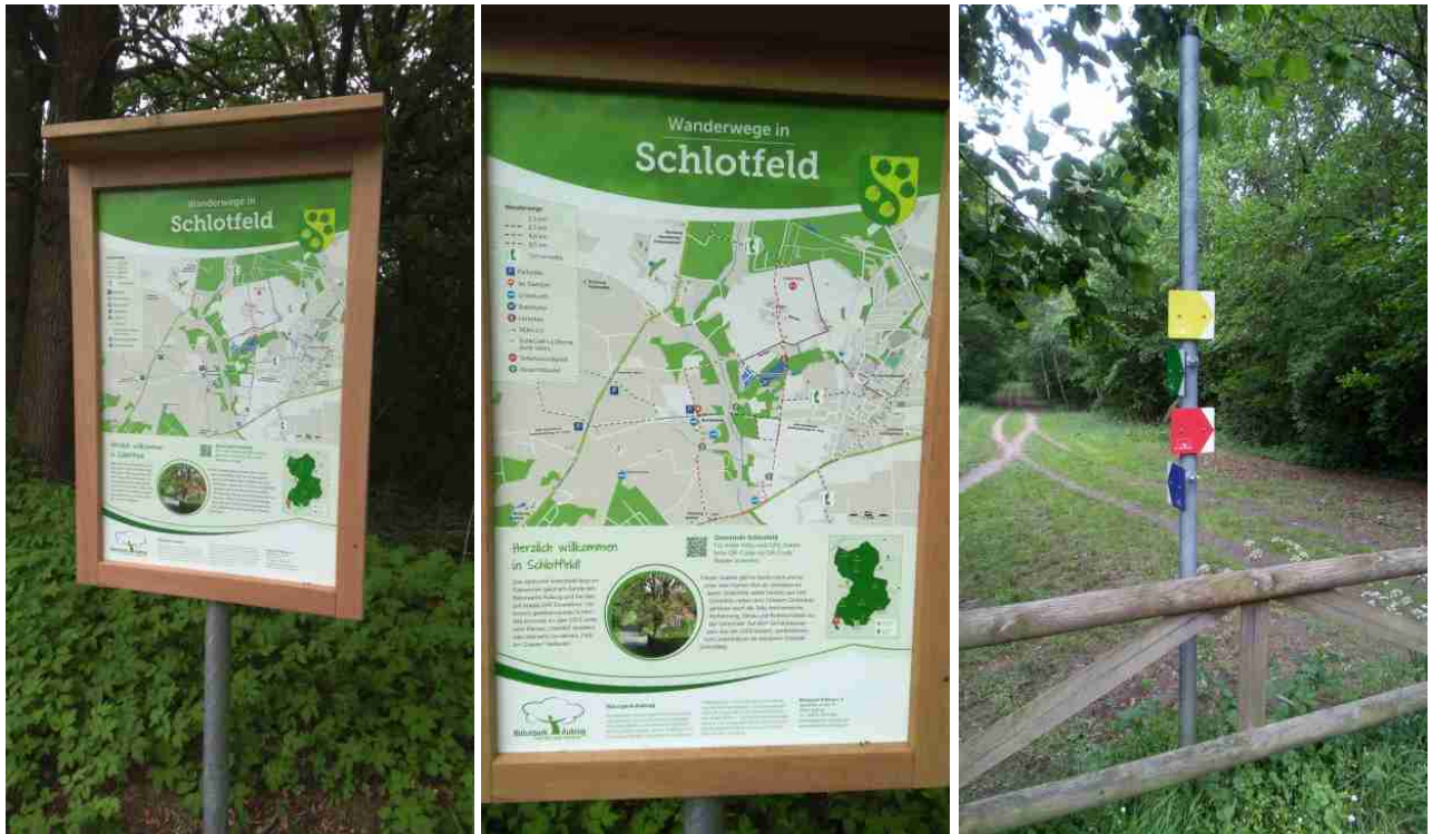
Neue Informationstafel und ein Beispiel für die neuen Wegweiser

Zahlreiche Gäste fanden sich zur Begrüßung ein. Gemeinsam wurden die Wanderwege erkundet. Strahlender Sonnenschein und gute Laune machten die Erweiterungseinweihung zu einem schönen Erlebnis. Auch VERA-Flächen sind an diesen Wegen zu finden, wie oben auf dem mittleren Bild an der Rantzau-Brücke „Bahndamm“. In Blickrichtung liegt unsere Sommerweide mit derzeit 9 Galloway-Rindern. Am Besichtigungstag waren sie natürlich noch nicht anwesend, aber ein Blick über die interessante Fläche war dennoch möglich. Cordelia berichtete den sehr interessierten Teilnehmern über die Entwicklung der Rantzau und VERA.