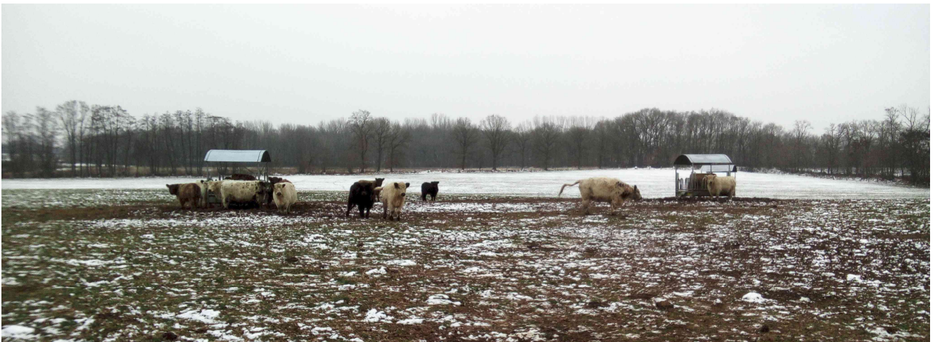
Kollmoorfläche nach Raufenfüllung im Januar