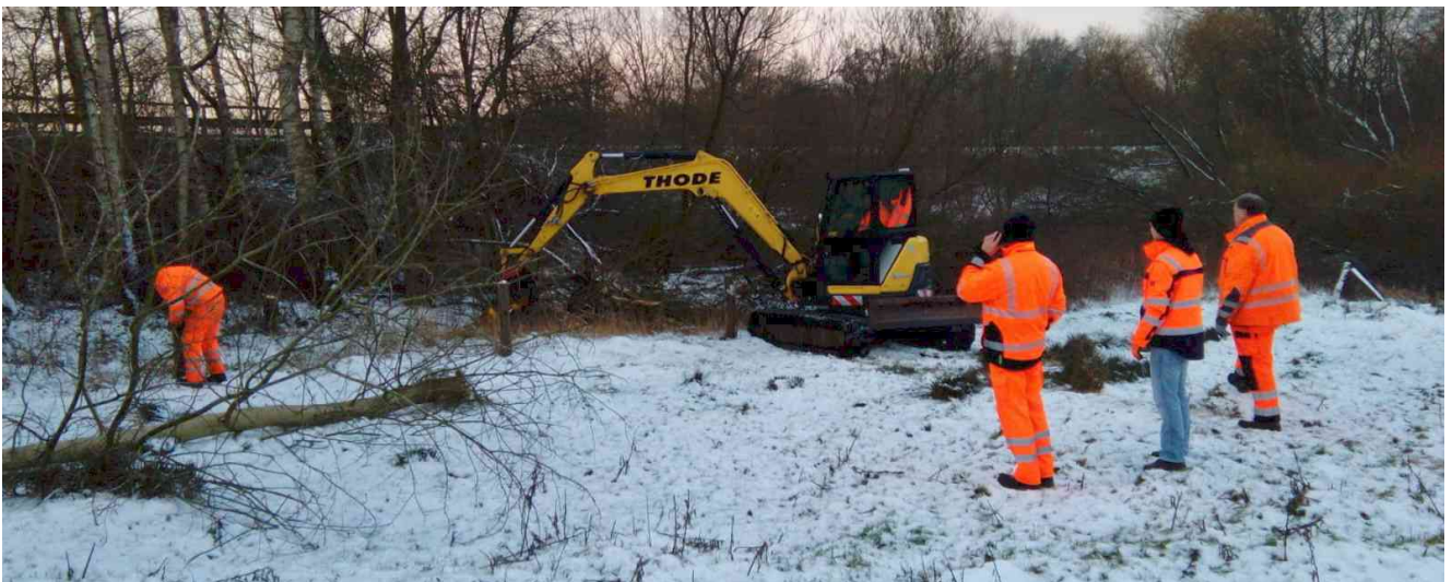
Arbeiten an der Böschung der B 206 (Brücke Rantzau) von unserer Stammplatzfläche aus