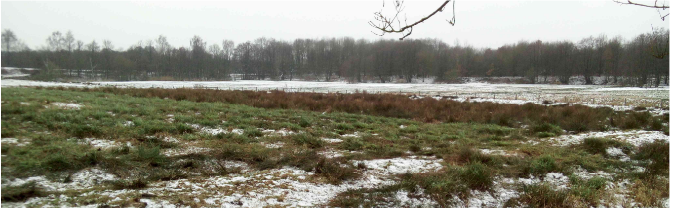
Stammplatzfläche (VERA 2) an einem frostigen Januartag